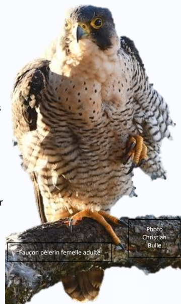
Faucon pèlerin femelle adulte

(Les dons ouvrent droit à une réduction d'impôts sur le revenu égale à 66% du montant versé, dans la limite de 20% du revenu imposable)