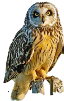
Hibou des marais