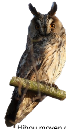
Hibou moyen duc